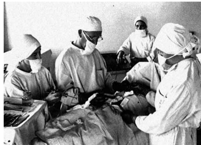
Операция в Куйбышевском военном госпитале

Для медицинских работников война стала настоящим испытанием. В 1941 году в передовице газеты «Правда» стратегическая задача, стоящая перед медициной, была сформулирована так: «Каждый возвращенный в строй воин — это наша победа. Это — победа советской медицинской науки... Это — победа воинской части, в ряды которой вернулся уже закаленный в сражениях воин».