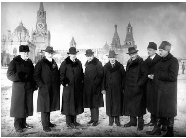
Профессора, лечившие В.И. Ленина. Москва, Красная площадь, март 1923 года