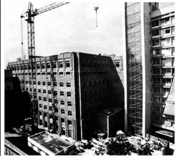
Завершение строительства 3-го корпуса

В 1991–1992 годы происходит объединение правительственных медицинских учреждений СССР и России. В результате реорганизации амбулаторно-поликлиническую помощь прикрепленному контингенту обеспечивали четыре поликлиники, в том числе и Поликлиника Правительственного Медицинского центра РФ.