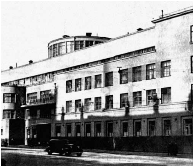
Здание Кремлевской больницы и Кремлевской поликлиники

В 1933 году созданное на базе амбулатории отделение Кремлевской поликлиники получает наименование «Кремлевская поликлиника № 1», а Кремлевскую поликлинику, в отличие от нее, называют «Центральной Кремлевской поликлиникой». Впоследствии их именуют соответственно Поликлиника № 1 и Центральная поликлиника.